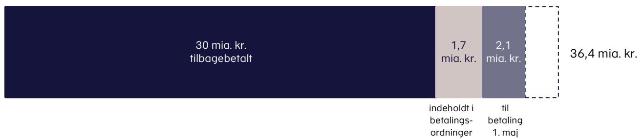
Figur 1. Oversigt over tilbagebetaling af coronalån pr. 24. april 2023

I alt er 31,7 mia. kr. betalt eller under betaling gennem betalingsordninger. Det svarer til godt 92 pct. af lånene, der har haft betalingsfrist.