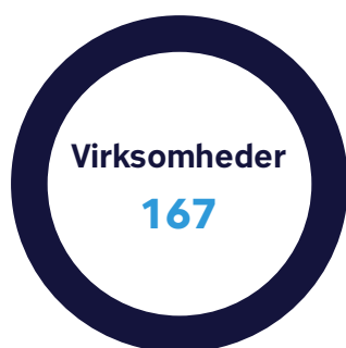
Figur 1. Foreløbige resultater fra kontrol af udenlandske internetvirksomheder, der sælger varer til danske forbrugere

Der er gennemført kontrol af 167 virksomheder.