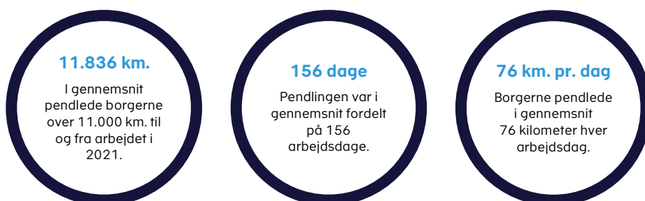
Figur 1. Borgernes gennemsnitlige pendling i 2021.

Anm.: Opgørelsen dækker over borgere med simple skatteforhold, der har oplyst om deres kørselsfradrag på TastSelv for indkomståret 2021.