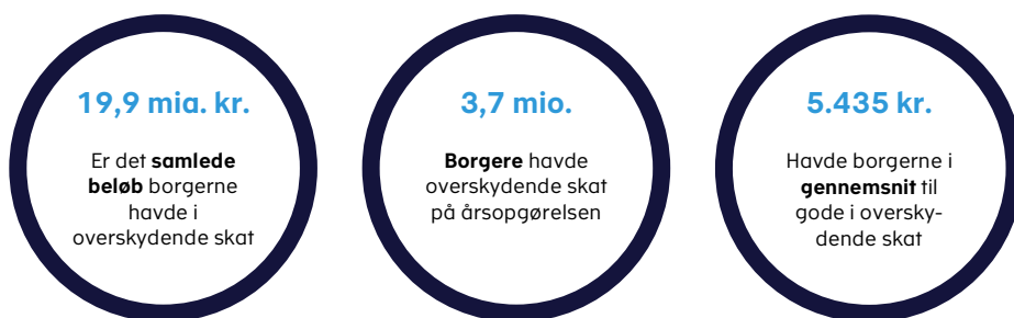
Figur 1. Nøgletal for udbetalingen af overskydende skat for indkomståret 2021.

Skattestyrelsens opgørelser for indkomståret 2021 viser, at 3,7 mio. borgere har 19,9 mia. kr. i overskydende skat. Det svarer til 5.435 kr. i gennemsnit per borger, jf. figur 1.