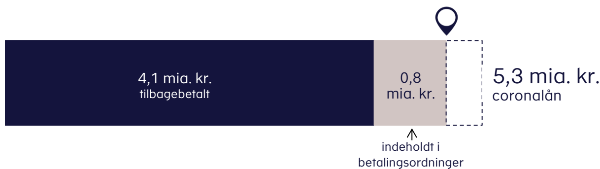
Figur 2. Tilbagebetaling af coronalån ved fristen den 1. juni (tal pr. 14. juni 2022)

Omkring 8.700 virksomheder stod ved fristen den 1. juni 2022 til at skulle tilbagebetale knap 5,3 mia. kr. i A-skattelån. Skattestyrelsens opgørelser viser, at der pr. 14. juni 2022 er tilbagebetalt godt 4,1 mia. kr., hvilket svarer til 78 pct. af det samlede beløb, jf. figur 2 .