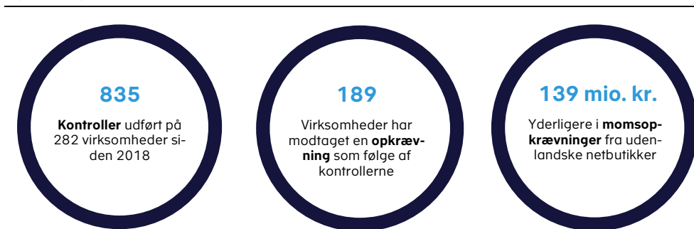
Figur 1. Nøgletal fra kontrolindsatsen af udenlandske netbutikker, 2018-2020

Anm.: I opgørelsen indgår resultaterne af et mindre antal kontroller af punktafgifter, som er gennemført i tilknytning til momskontrollen af punktafgiftspligtige virksomheder.