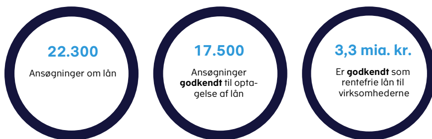
Figur 1. Nøgletal for A-skattelåneordninger

I alt har Skattestyrelsen modtaget ca. 22.300 ansøgninger om et rentefrit lån via de to A-skattelåneordninger, der har været åbne i perioden fra den 3. februar til den 8. april 2021. Samlet er ca. 17.500 ansøgninger blevet godkendt til rentefrie skattelån for ca. 3,3 mia. kr., jf. figur 1 . Det svarer til, at 79 pct. af de behandlede ansøgninger er imødekommet af Skattestyrelsen.