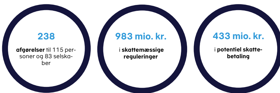
Figur 1. Nøgletal fra kontrolindsatsen af sagskomplekset omkring Panama Papers siden 2016

I perioden fra 2016 til januar 2021 har Skattestyrelsen truffet i alt 238 afgørelser, der har givet anledning til skattemæssige reguleringer for knap 1 mia. kr., jf. figur 1 . Reguleringer af den skattepligtige indkomst indarbejdes i årsopgørelsen, hvor den manglende skattebetaling vil fremgå. De 238 afgørelser vedrører 115 personer og 83 selskaber.