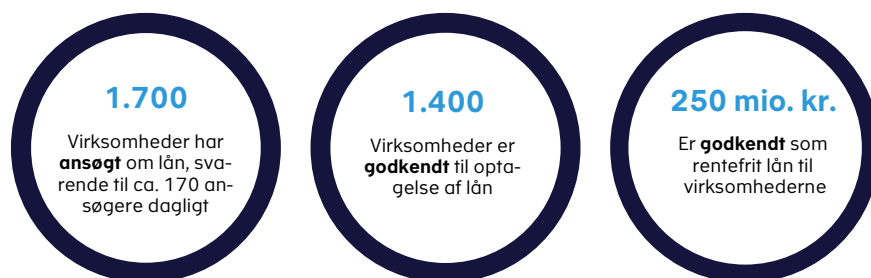
Figur 2. Status 10 dage efter genåbning af låneordning

Blandt de knap 1.700 virksomheder, der har ansøgt om et lån i løbet af de ti første dage, har knap 1.400 virksomheder fået godkendt deres ansøgning om lån. Samlet er der godkendt lån for ca. 250 mio. kr., jf. figur 2.