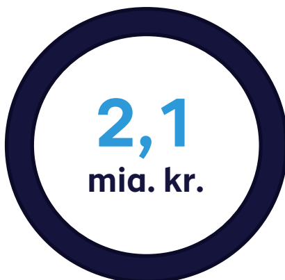
Figur 1. Samlet skatteregning for kontrolsager

Den seneste Money Transfer-indsats har medført skatteregninger for ca. 400 mio. kr.