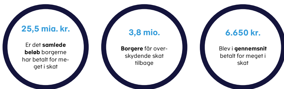
Figur 1. Nøgletal for udbetalingen af overskydende skat for indkomståret 2022.

Hver borger med overskydende skat har i gennemsnit betalt 6.650 kr. for meget.