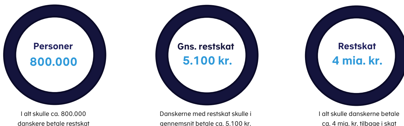
Figur 2. Fakta om danskernes restskat i 2018

I marts 2019 fik i alt 800.000 borgere i Danmark således besked om, at de havde betalt for lidt skat i indkomståret 2018 og derfor skulle betale restskat. Samlet skulle danskerne betale ca. 4 mia. kr. i restskat. Danskerne, med restskat på årsopgørelsen, skulle i gennemsnit betale ca. 5.100 kr., jf. figur 2 .